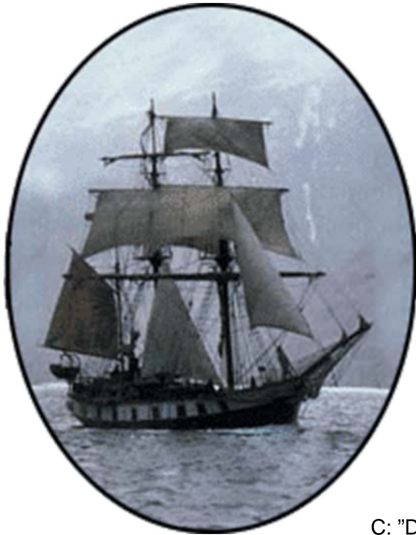
C: "Darwin Heritage"