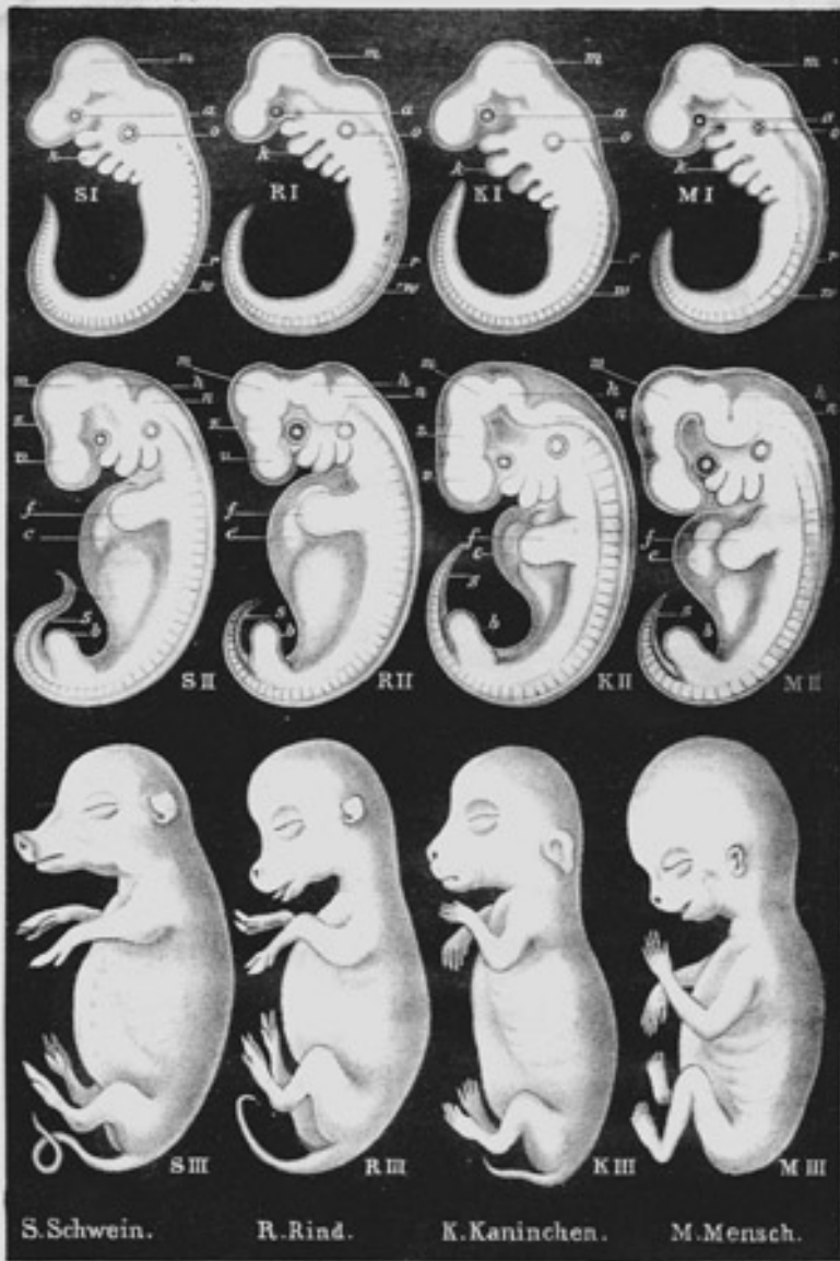
Haeckel 1866 - -